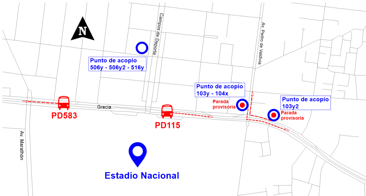
Ilustración 2: Puntos de acopio Estadio Nacional

Los puntos de parada de los servicios 103y, 103y2 y 104x también se utilizarían como punto de acopio.