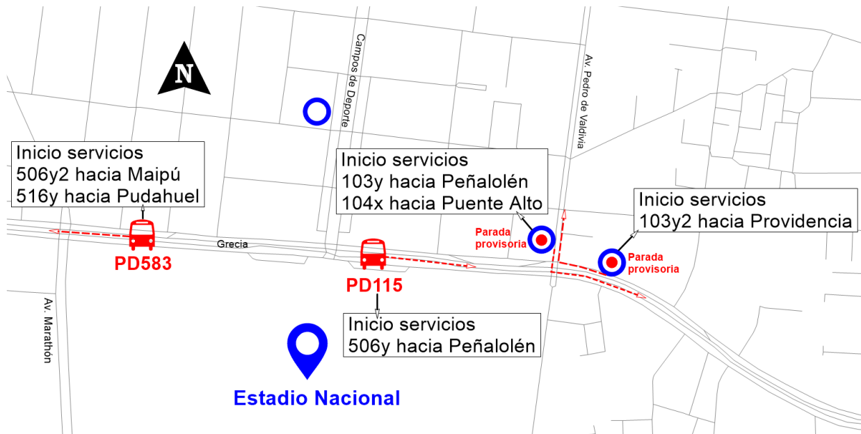
Ilustración 1: Paradas Salida Estadio Nacional